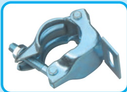
片開き用クランプ