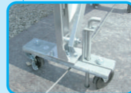
キャスター下部 落とし棒