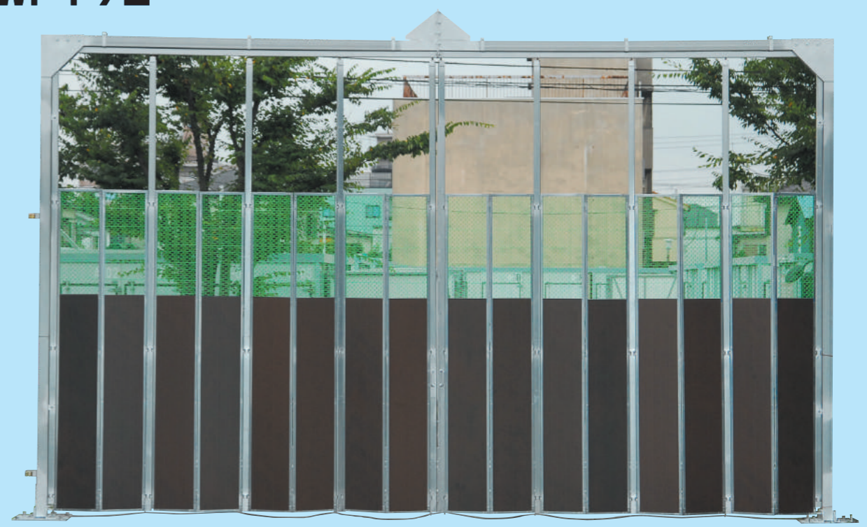
■WP1 (WP2) シリーズゲート仕様