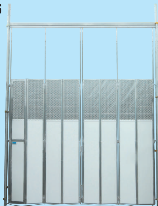
■SP3 (SP4) ゲート仕様